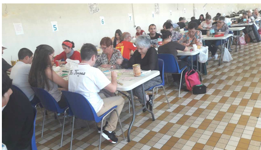
Loto du 10/03/18