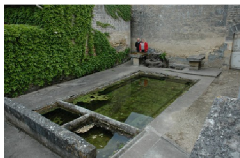
Lavoir de La Voûte

Mon arrière grand-mère, Marie, était laveuse, elle me racontait souvent ses doigts raidis, tordus par les crampes à force de frotter draps, chemises et pantalons, elle parlait du lavoir, véritable rendez-vous du quartier, où, les jours de beau temps, on bavardait gaiement autour des bassins de pierre. Il y avait aussi les confidences, les commérages et les médisances. On s'y transmettait les trouvailles, les astuces, les cachotteries, mais il y existait aussi les réticences, les convoitises, les secrets jalousement gardés.