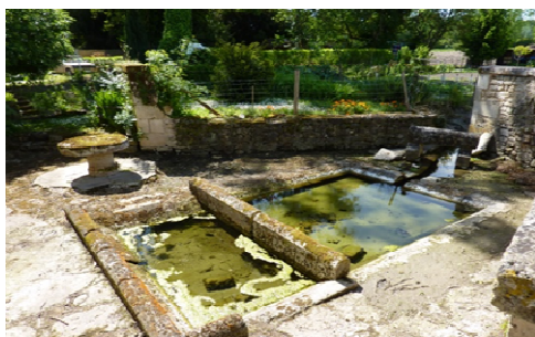
Lavoir du bourg

Sa fréquentation était exclusivement féminine avec parfois des enfants, c'était un endroit où les femmes pouvaient se retrouver et échanger.