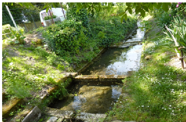
Lavoir Chez Tétaud